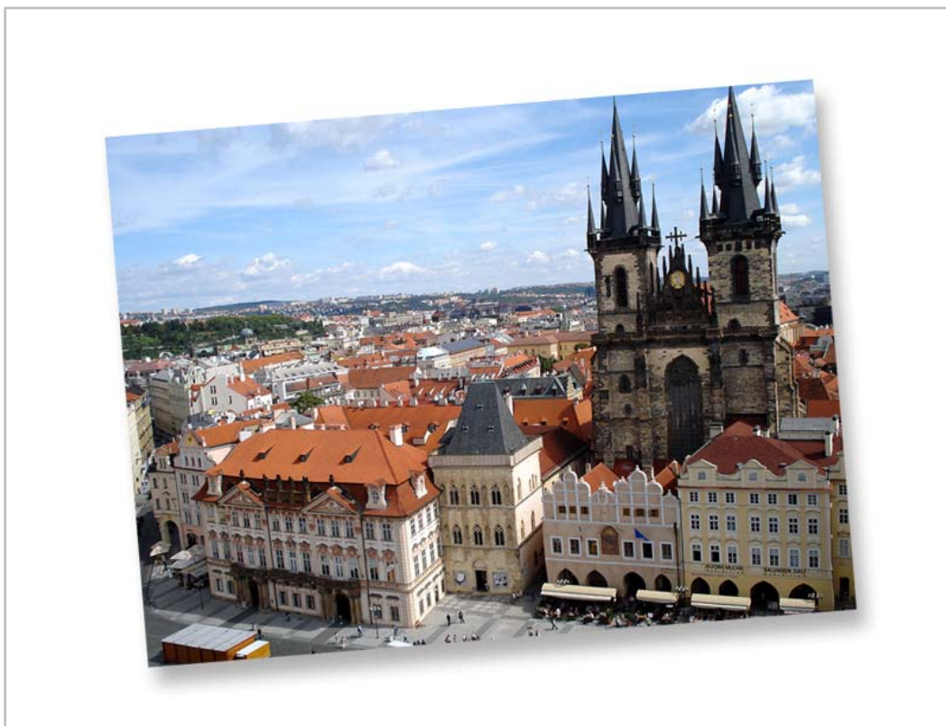
Obr. 2 Praha, Staroměstské náměstí

Při porovnání vývoje cestovního ruchu je nutné konstatovat, že v Čechách a na Moravě to byl průběh velmi nerovnoměrný, což bylo způsobeno nejen infrastrukturou, ale také neznalostí nabídky jednotlivých oblastí resp. nedostatečnou či chybějící osvětou (propagací). Slovensko bylo dokonce v počátečním období po vzniku nového společného státu zemí poměrně zaostalou, nejen v oblasti cestovního ruchu. Cílovými destinacemi byla především Praha následována lázeňskými městy.